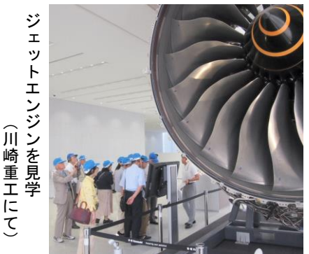
ジェットエンジンを見学（川崎重工にて）

れ、さらに学友会の会員同士のカップルも数組あり、お互いに説明し合うほほえましい風景もみられました。