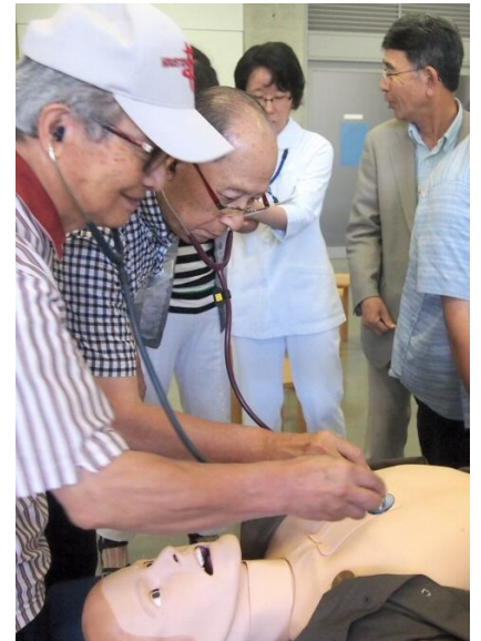
高機能人体模型の心臓の鼓動を聴診器で聴く参加者

正面玄関の展示ブースには、ジェットエンジンの実物がカバーを取り外した状態で展示されていて、見学者の目を引いていました。