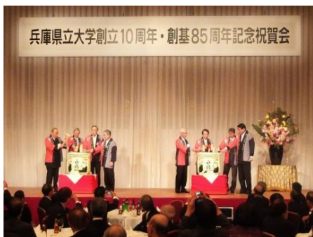
祝賀会での鏡割りの様子